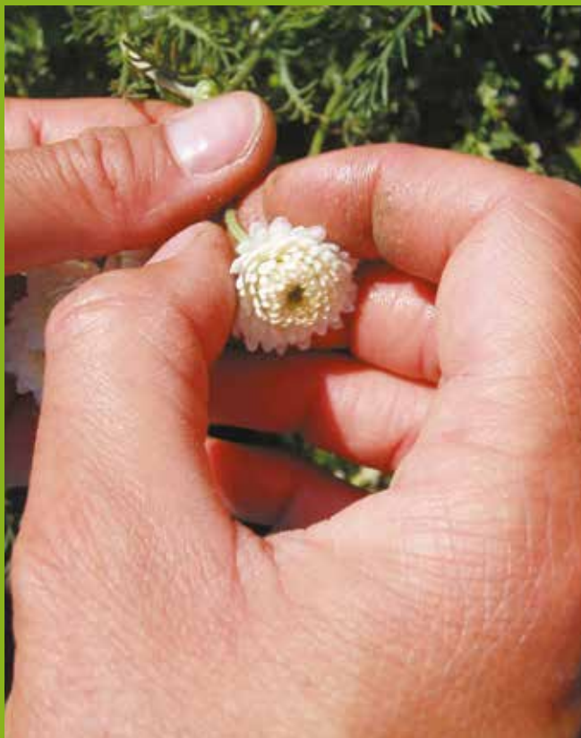
Camomille romaine à fleurs doubles