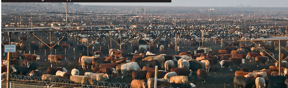
Deux modèles agricoles s'opposent.

La question n'est donc pas simplement agricole. Elle relève d'un choix de société : quelle agriculture et quelle alimentation voulons-nous ?